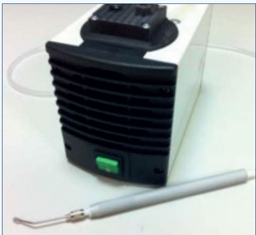
Vakuová pinzeta včetně vakuové pumpy