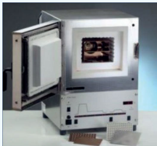
Programovatelná TLD pec