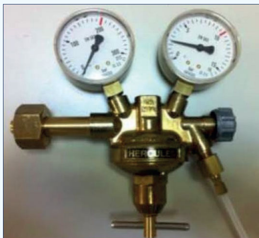
Reduktor tlaku plynu N 2 , metrický