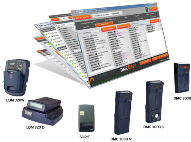
DMC User SW