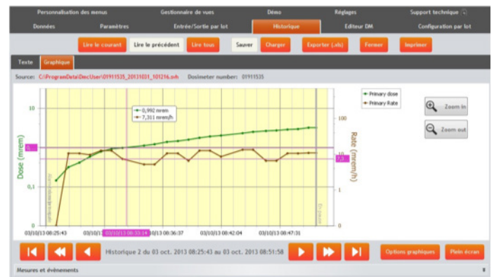
Historie měření dávky